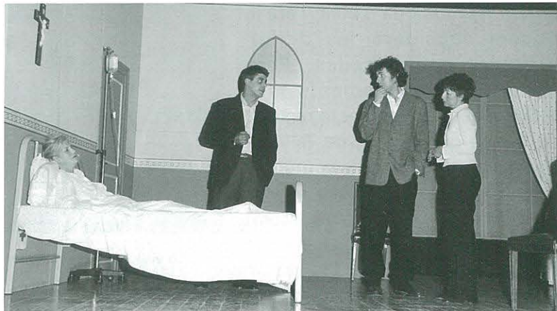
"Sentiments dividits", per "NAVÀS GRUP ESCÈNIC", de Navàs

El darrer diumenge d'octubre ens visita el "Navàs Grup Escènic" de Navàs, amb moltes ganes d'actuar a Ulldecona -segons els seus comentaris- pel local i en particular pel públic, molt entès en teatre i crític. L'autor de l'obra és el mateix director del grup i en la qual fan un gran treball tots els actors. Una gran obra i una molt bona direcció. Tothom va passar una tarda molt agradable pel contingut i saber fer. Grans aplaudiments i ben merecuts.