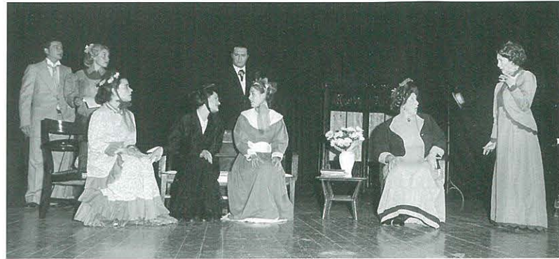
"La intel·lectual", pel Grup "LLOP'S TEATRE SF/87", de Reus

El tercer dia Llop's Teatre SF/87, de Reus, amb el que també tenim amistat, ens va representar una gran obra, La intel·lectual de Santiago Rusiñol, i com totes les obres d'aquest gran autor, molta gent -dotze- amb les dificultats que porten les obres amb tants personatges. La posta en escena és sempre difícil, els esforços de la direcció molt grans i si no es lliga tot molt bé, sempre queden punts foscos que fan baixar la qualitat de l'obra.