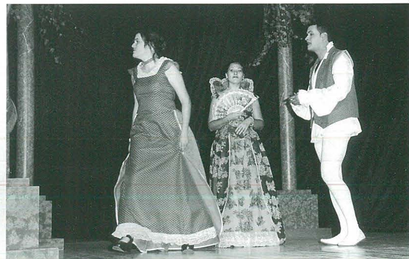
"L'autèntic amic", pel "TEMPO TEATRE", de S. Jaume d'Enveja

La sisena jornada, els nostres amics de St. Jaume d'Enveja, van representar "L'autèntic amic" de Carlo Goldoni, un dels millors escriptors de caire naturalista. Les seves obres avui en dia encara es representen a tot el món pel seu teatre de text a l'altura dels millors escriptors. Creà en el seu temps una nova línia del saber fer, buscant que els seus personatges s'expressin amb un llenguatge viu i natural, d'acord amb el paper i personatge que representen, sense improvisacions per no crear una vulgaritat dins l'obra per part de l'actor en els seus artificis. Per aquest motiu fou molt criticat.