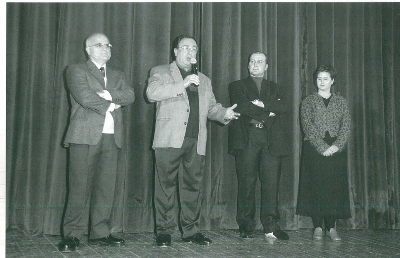
Cloenda de les XIX Jornades de Teatre d'Ulldecona