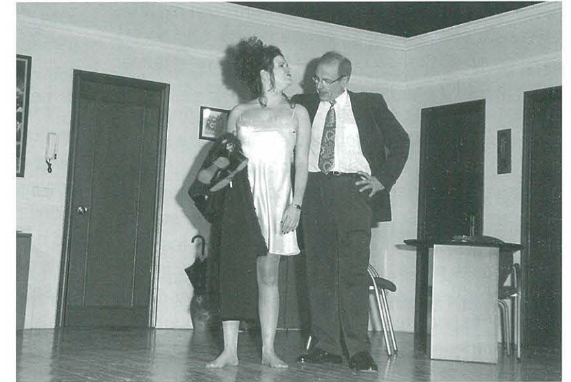
"A l'armari i al llit al primer crit", pel "Centre Cultural i Recreatiu d'Ulldecona"

És molt il·lustratiu la posició crítica que puguin mantenir tant les entitats organitzadores com els grups que actuen, tots en el mateix context, superant-se cadascú en lo d'ell i buscant una literatura teatral en la que saber examinar ben a fons, d'on venim i on volem anar, per a que les entitats culturals siguin precisament això, creadores i repartidores de cultura, del saber fer dins les seves possibilitats, per a que uns actors vinguin a representar i el públic vingui a gaudir del bon treball creant il·lusió.