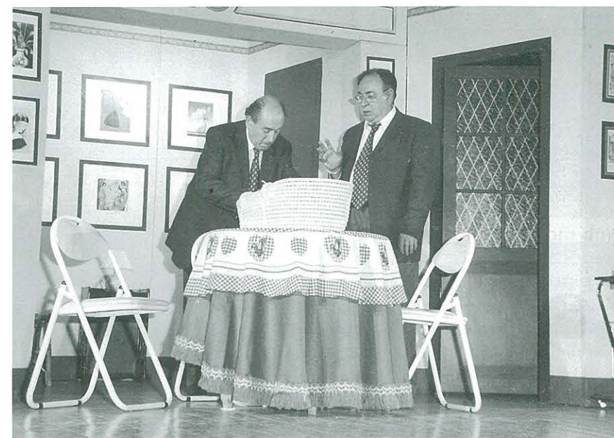
"La visita que no va tocar el timbre", pel Grup "BELLES ARTS TEATRE", de Lleida

L'any passat aquestes Jornades de Teatre, després de divuit anys sense interrupció van arribar a la majoria d'edat, i ara ja podem considerar-les definitivament consolidades. Però entrem en els moments més delicats per a conservar la rectitud de l'arbre que és l'art de Talía, la musa que representa la comèdia i la poesia lleugera, amb la qual, tants moments bons hem passat, passem i fem passar.